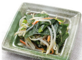
お浸し 100g 200円(税込)