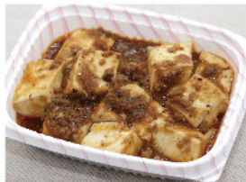
四川風麻婆豆腐 100g 200円(税込)