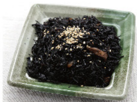
ひじき煮 100g 200円(税込)