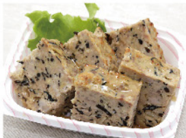
ひじき入りミートローフ 200g 300円(税込)