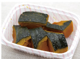
南瓜煮 150g 200円(税込)