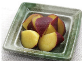
さつま芋のレモン煮 150g 200円(税込)