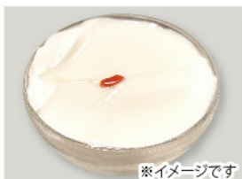
杏仁豆腐 200g 200円(税込)