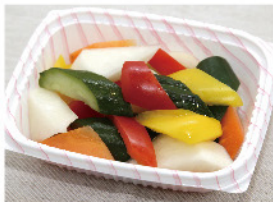
こだわりピクルス 150g 200円(税込)