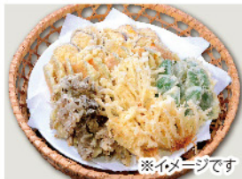
野菜天ぷら 150g 300円(税込)